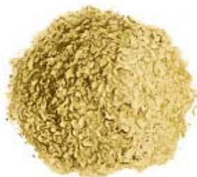
Sheng Di Huang 生地黄 (Radix Rehmanniae Glutinosae) : Digitale de Chine