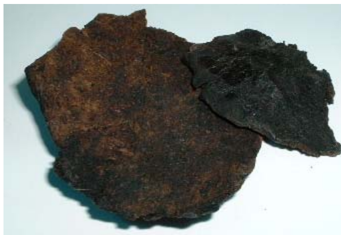
Sheng Jiang 生姜 (Zingiberis Officinalis Recens) : Gingembre